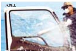
セキュリティフィルム窓に対する金属バット試験例