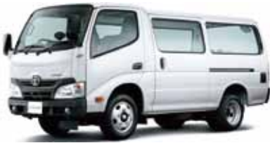
ダイナ ルートバン