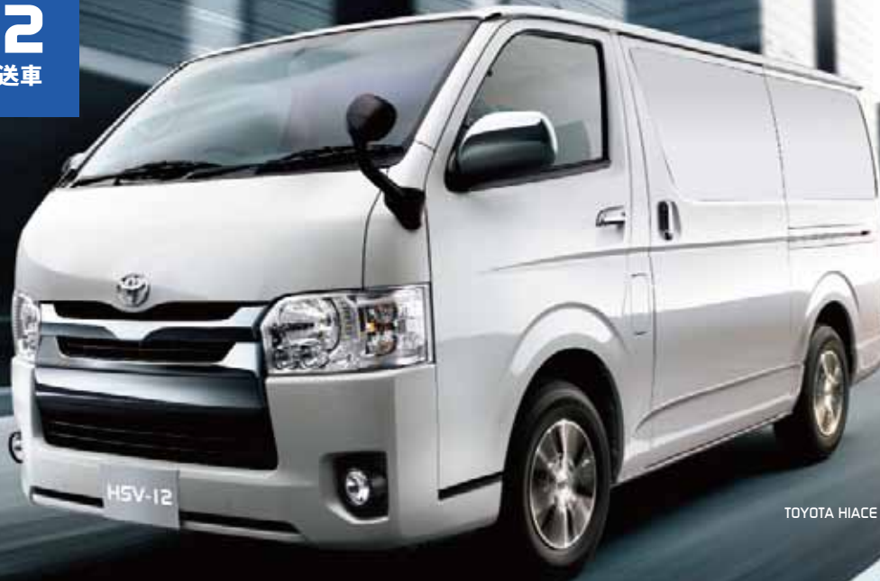
TOYOTA HIACE VAN