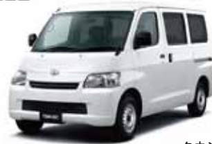
タウンエース バン