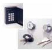
ダブルロックシステム