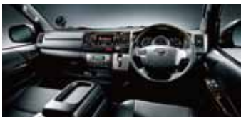
セキュリティフィルムにより防護された窓・キャビン