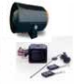
セキュリティシステム